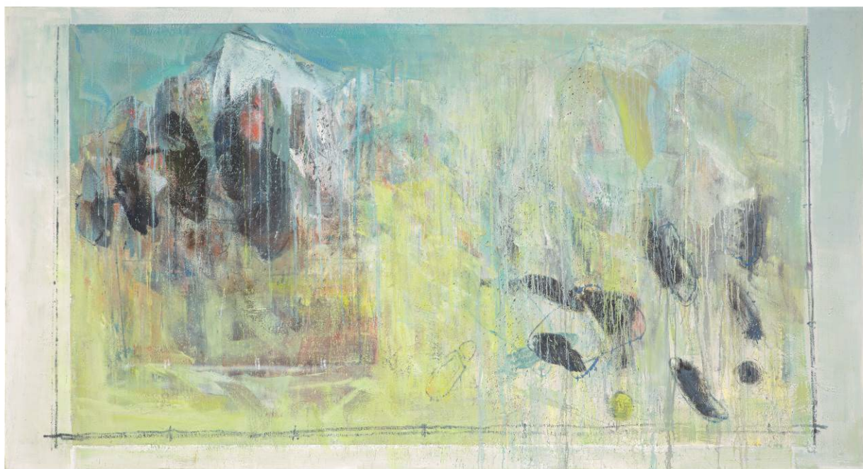
La terra trema , 2021, olio su tela, 171.8 x 320 cm

Il Museo d'arte Mendrisio inaugura la stagione espositiva 2023 con una grande antologica dedicata al pittore ticinese Cesare Lucchini (1941). Nato a Bellinzona e tra gli artisti più importanti della sua generazione, Lucchini conclude la formazione nel 1965 all'Accademia di Belle arti di Brera a Milano, dove vive e lavora per i successivi vent'anni. Alla fine degli anni Ottanta, desideroso di entrare in contatto con la scena artistica e culturale tedesca, si trasferisce in Germania dove tiene a lungo un atelier a Düsseldorf e a Colonia. Oggi vive e lavora a Lugano.