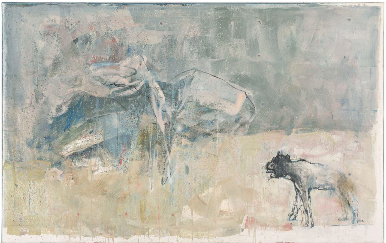
Quel che rimane-BP Messico, 2010, olio su tela, 183.5 x 292.5 cm

Tra i pochi artisti ticinesi conosciuti a livello europeo e regolarmente presente alle principali fiere internazionali, Lucchini ha esposto in diverse importanti gallerie italiane, tedesche e inglesi oltre ad essere stato scelto per significative personali presso istituzioni culturali svizzere, tra le quali la Pinacoteca comunale Casa Rusca di Locarno, il Musée d'art et d'histoire di Neuchâtel, il Museo Cantonale d'Arte di Lugano, le Kunstsammlungen di Chemnitz e, nel 2016 – 2017, il Kunstmuseum di Berna.