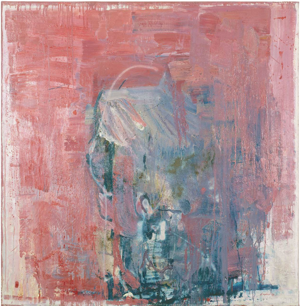
Quasi una testa , 2000, olio su tela, 146 x 142.4 cm, Collezione privata, Lugano

Sono nate così opere di grandi dimensioni (tra cui diversi dittici) nelle quali l'artista esplora e illustra momenti cardine della nostra storia recente: dalla situazione umanitaria dei rifugiati alla crisi eco climatica, a cui si aggiunge un rinnovato rapporto con la montagna e con alcune particolari iconografie sacre (tra cui l' Ultima cena ).