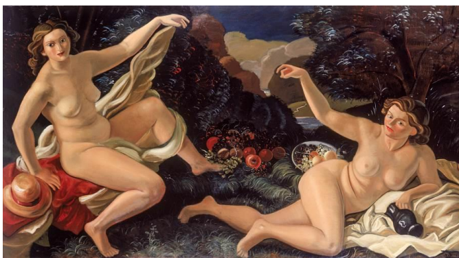
La Clairière, ou le déjeuner sur l'herbe