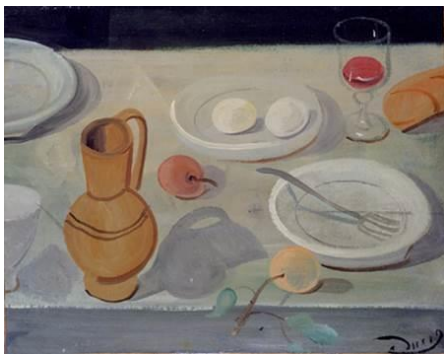
Nature morte au pichet et verre de vin