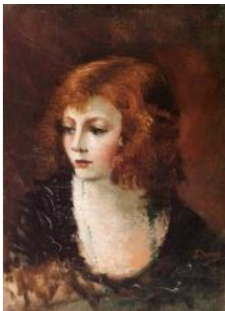
Portrait de femme