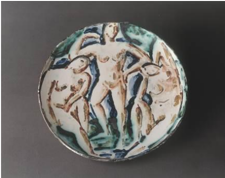
Senza titolo, trois baigneuses