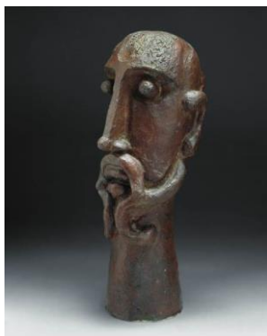
Le vieux gaulois