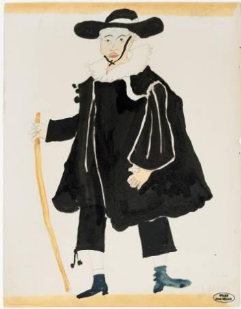
Bozzetto per "Il barbiere di Siviglia"