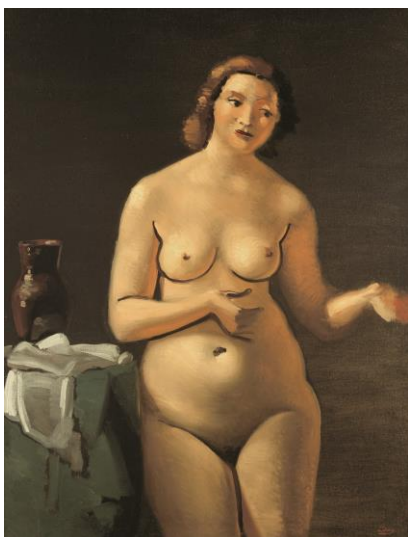
Nu debout de face – à la nature morte