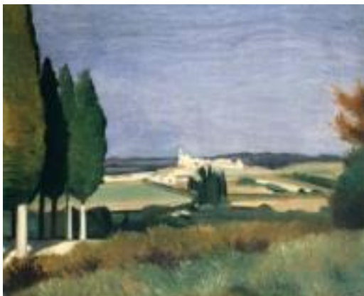
Paysage de Provence