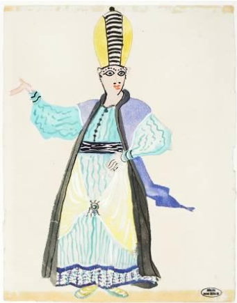
Bozzetto per "Il ratto del serraglio"