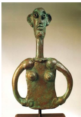
Femme au long cou