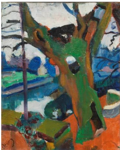
Le vieil arbre