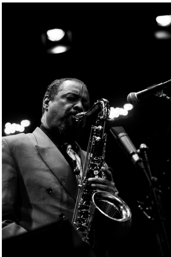
Chico Freeman, Chiasso, 2019