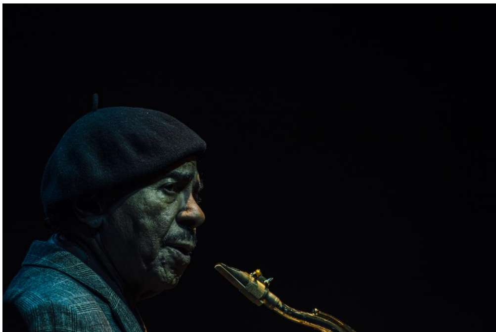
Benny Golson, Chiasso, 2016

Casa Pessina, Ligornetto 12 giugno – 10 luglio 2022