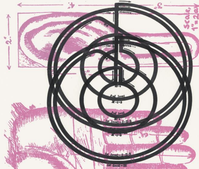
(Fig. 3.) Ear, drawn in accordance with the measurements given in the Suprabhédāgama .