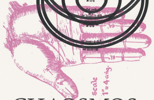
(Fig. 2.) Palm of the hand, drawn in accordance with the measurements given in the Amśumadbhédāgama .